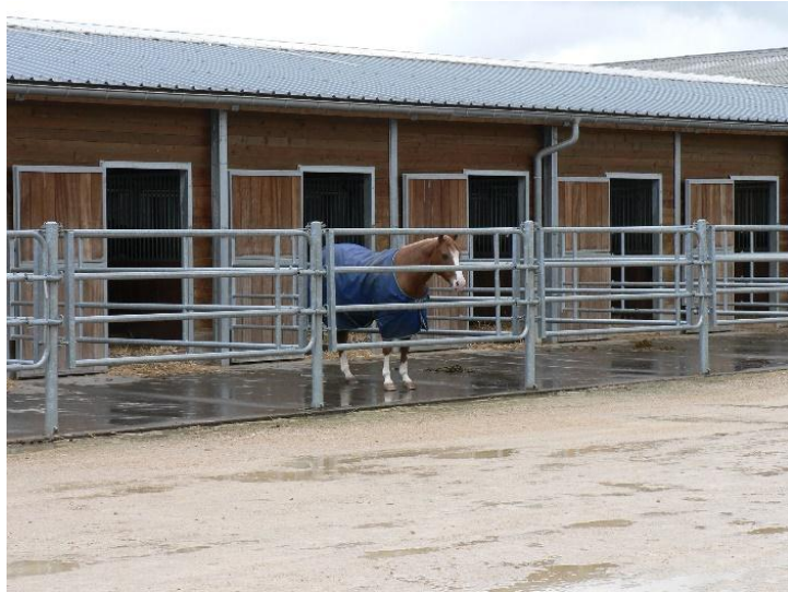
Aire de sortie toutes saisons